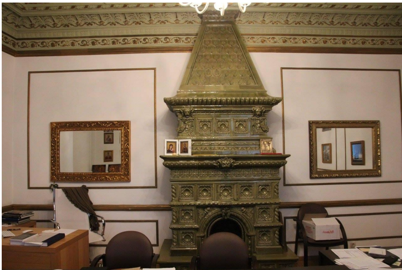
Дома купца Емельянова