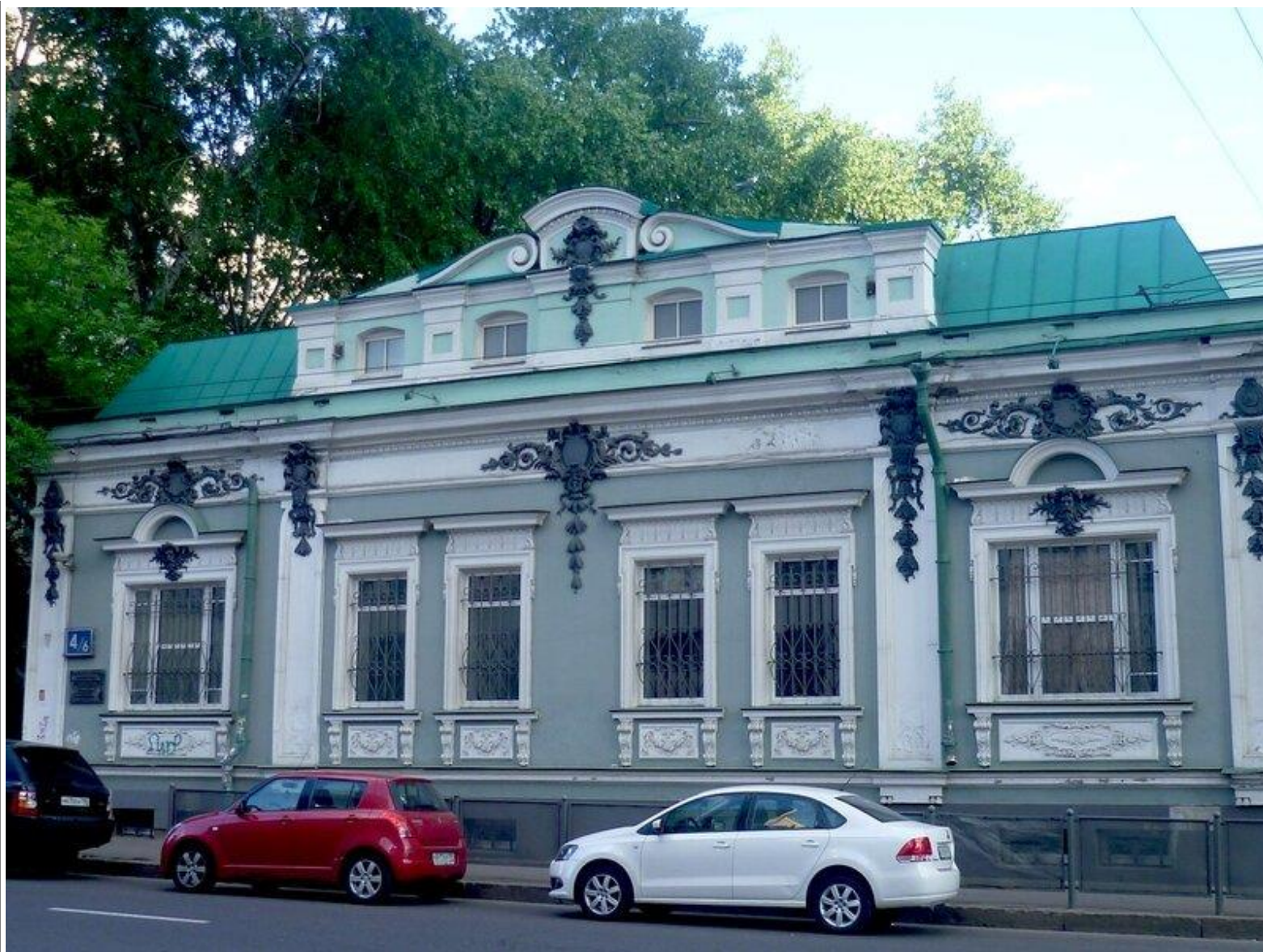
Особняк купцов Калининых