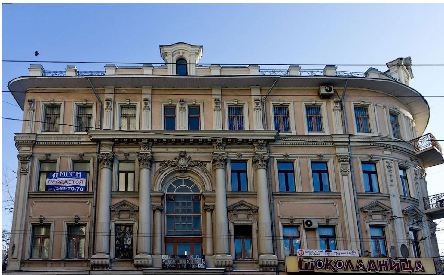
Дом купцов-старообрядцев Рахмановых.