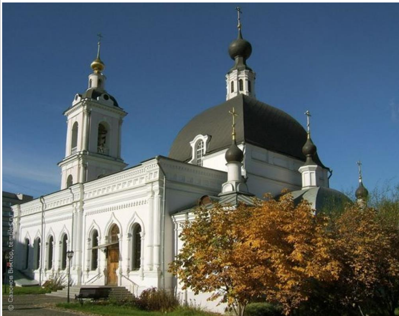
Храм Николая Чудотворца в Покровском