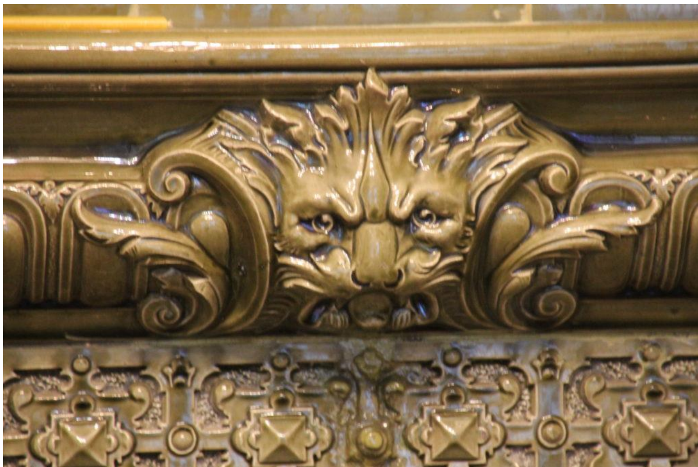
Интерьер Дома купца Емельянова