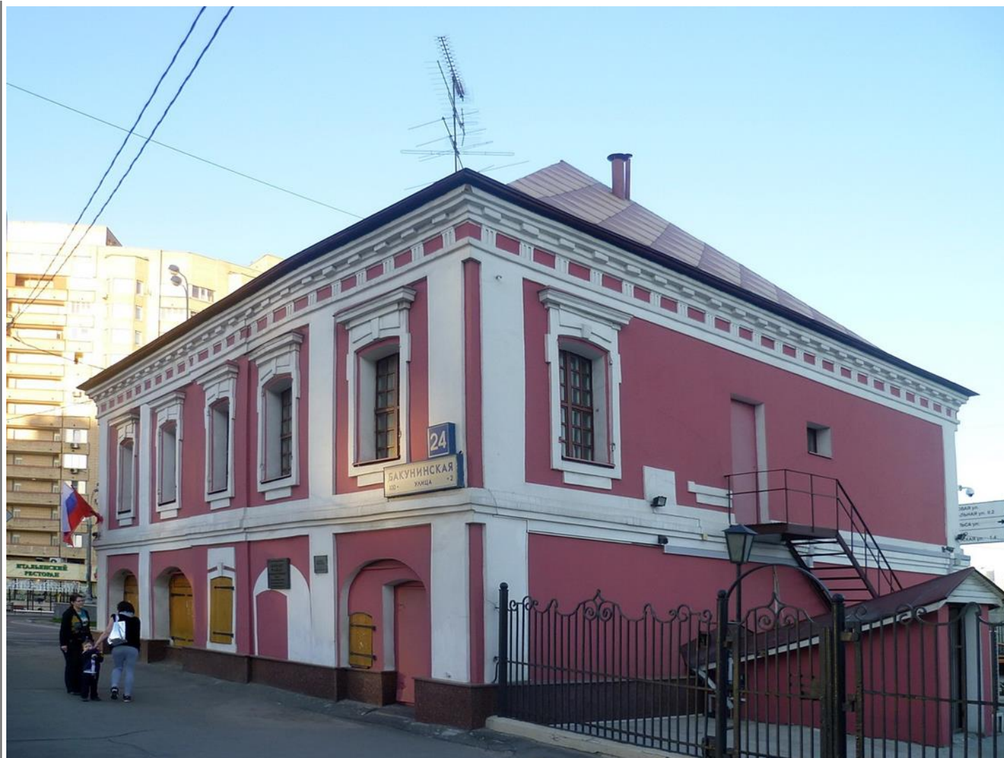
Палаты Щербаковых - Смирновых.