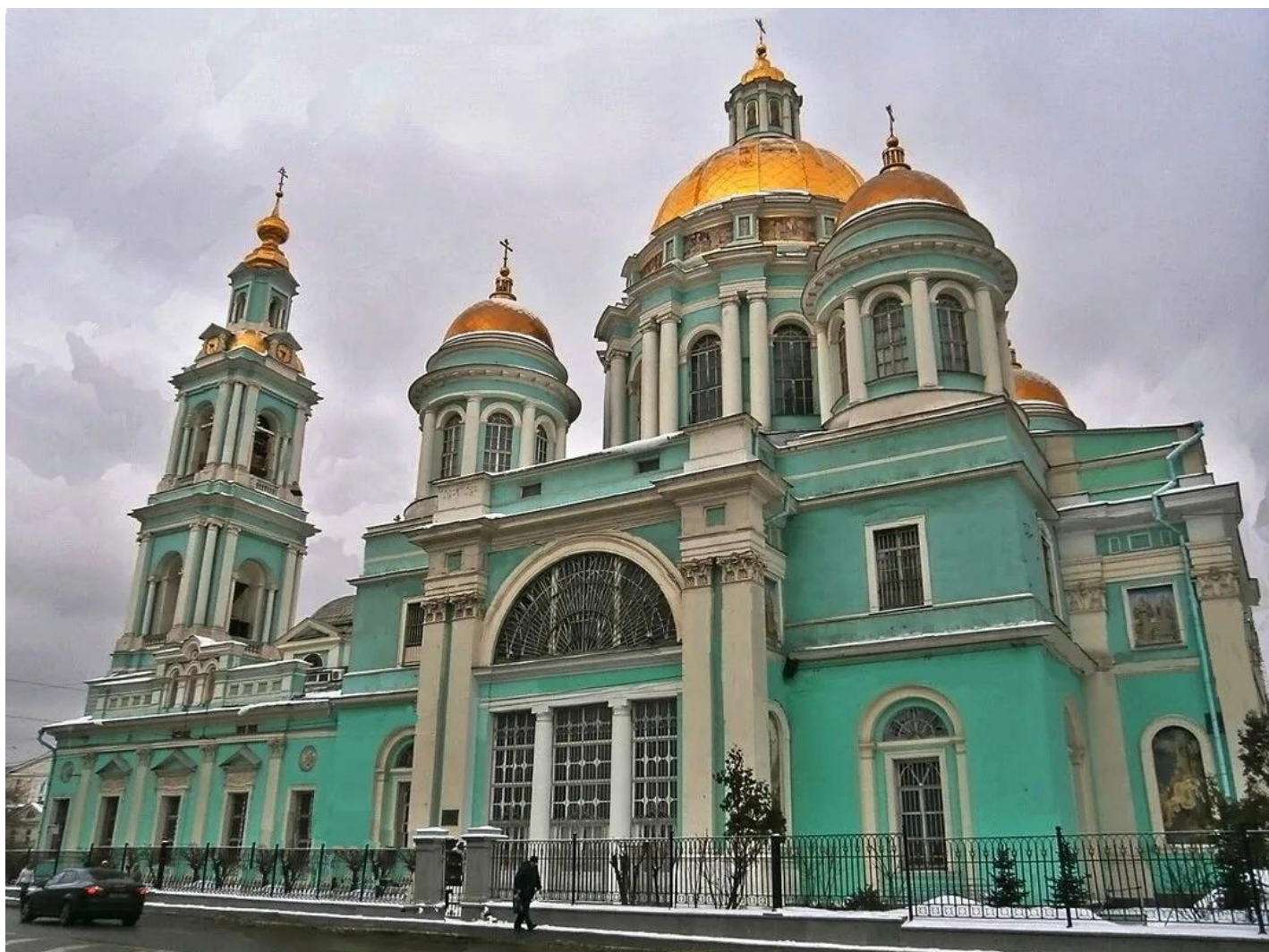
Собор Богоявления в Елохове