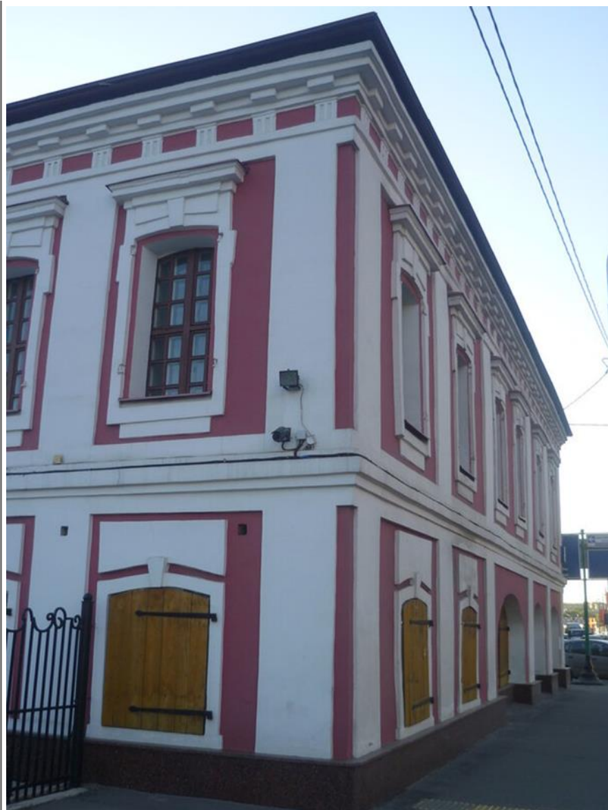
Палаты Щербаковых - Смирновых.