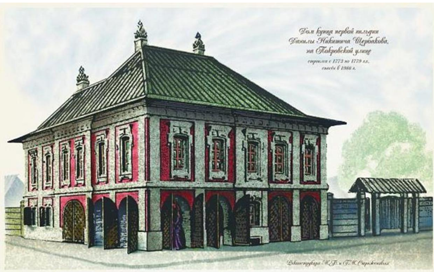
Палаты Щербаковых - Смирновых.