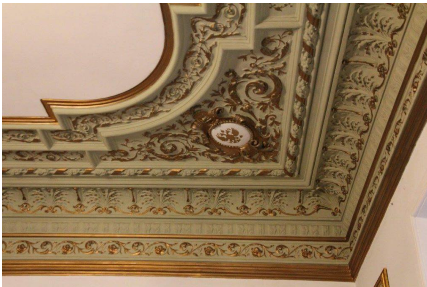
Интерьер Дома купца Емельянова