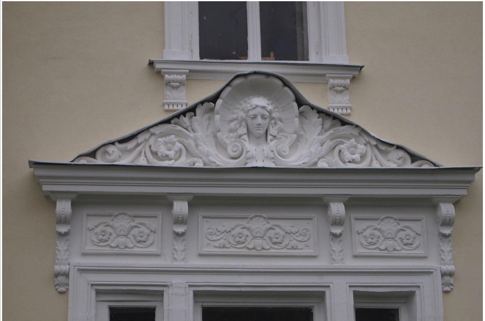
фрагмент наличника господского дома