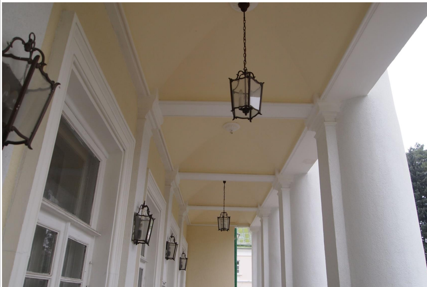
Господский дом фрагмент