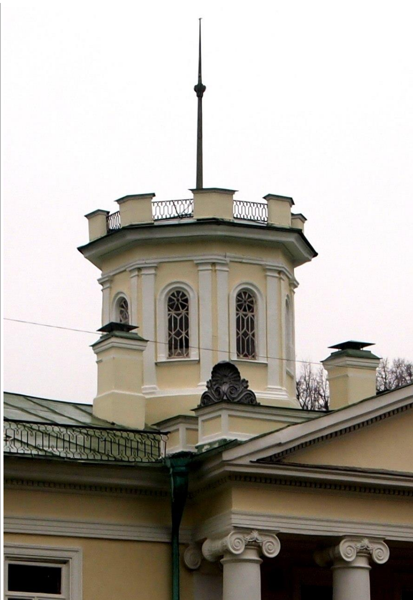
Бельведер господского дома