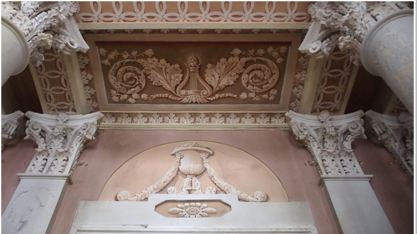
Детали отделки Марсового зала