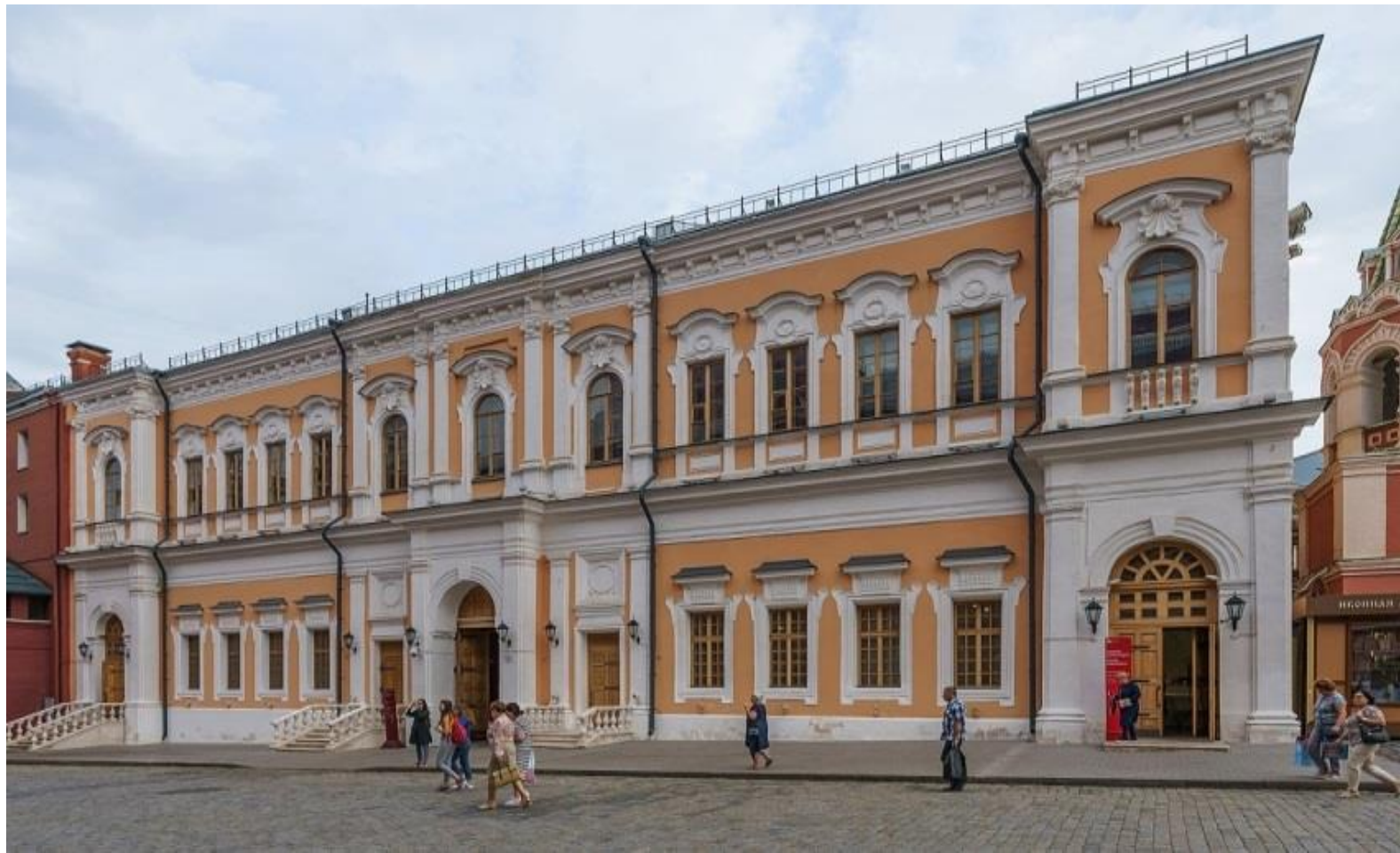
Здание присутственных мест (Дом губернского правления)