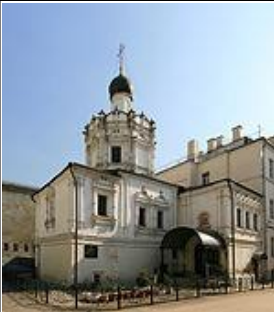
Чижевское подворье Храм Успения Пресвятой Богородицы