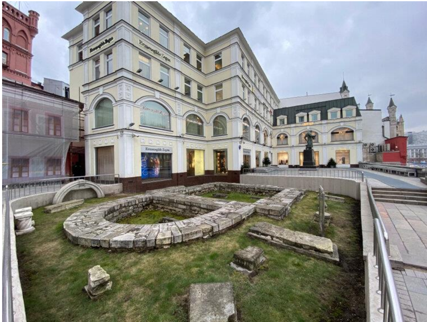
Церковь Святой Живоначальной Троицы что в Полях (фундаменты)