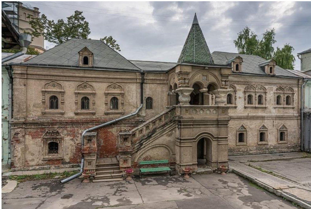
Правильная палата (Теремок)