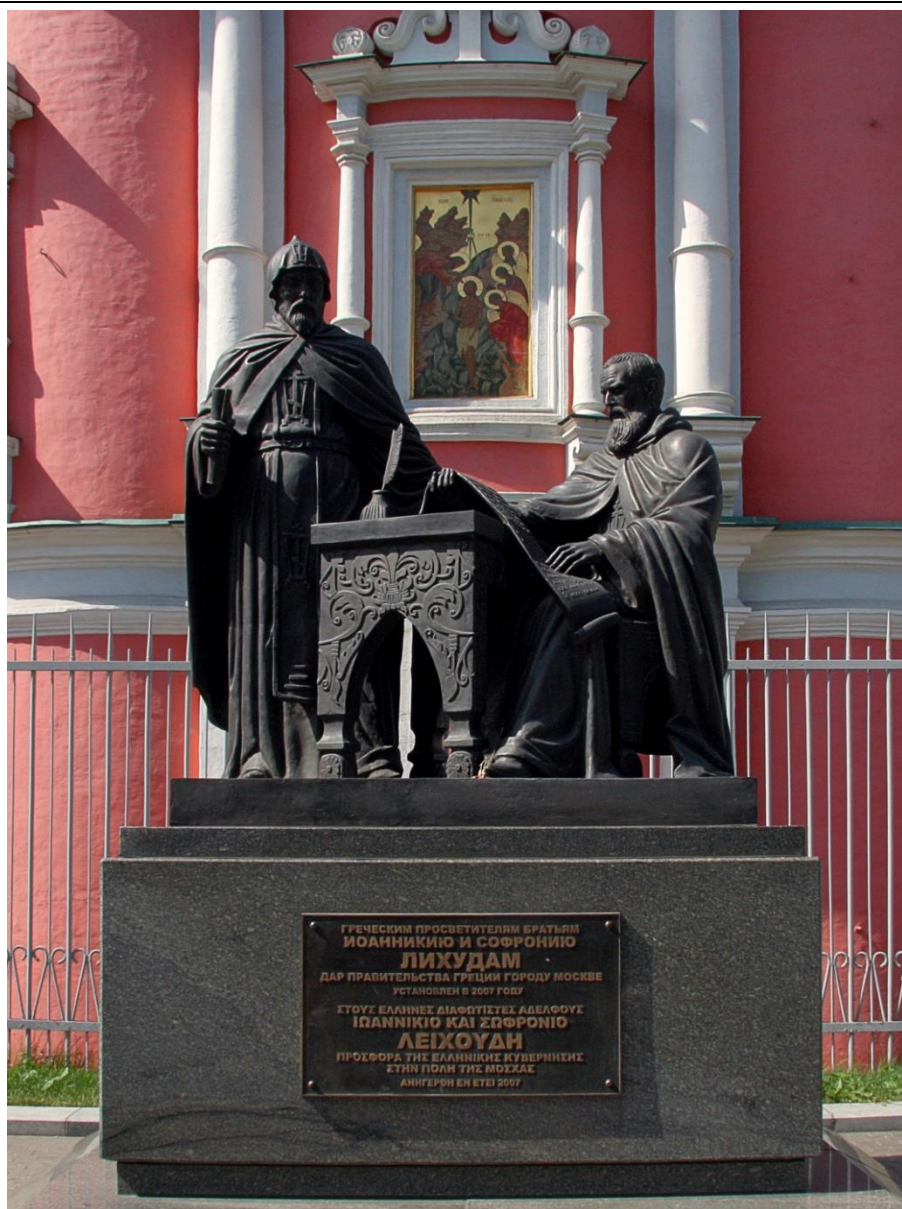
Памятник братьям Лихудам, создателям Славяно-Греко-Латинской академии (у стен Богоявленского собора Китай-города)