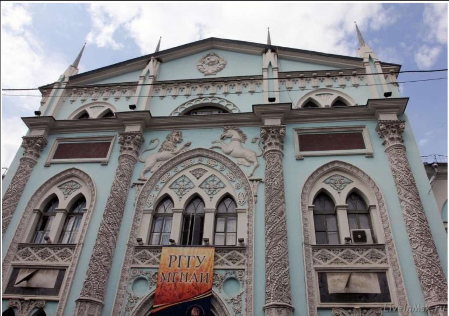
Синодальная типография. Историко-архивный институт РГГУ