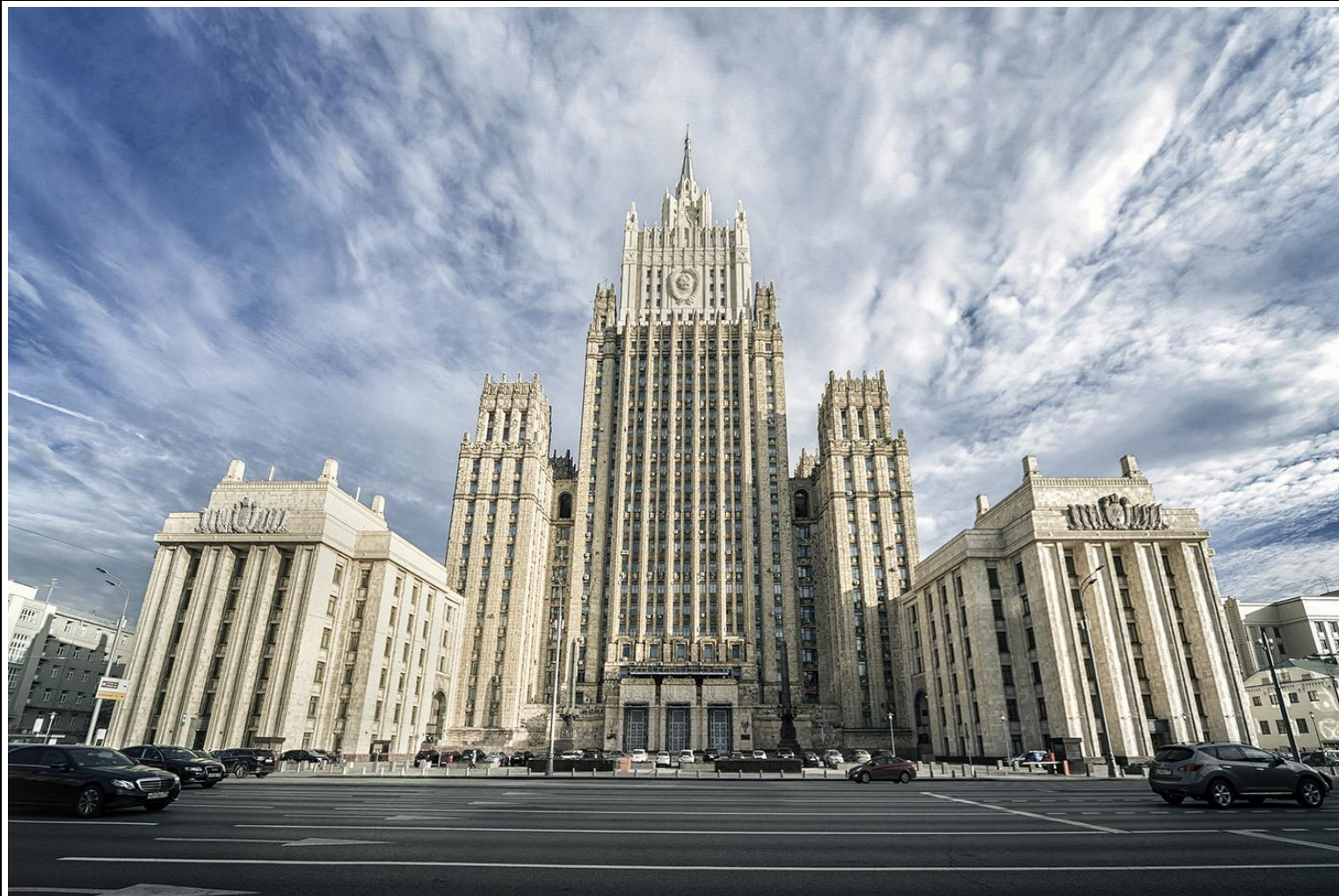
Министерство Иностранных Дел