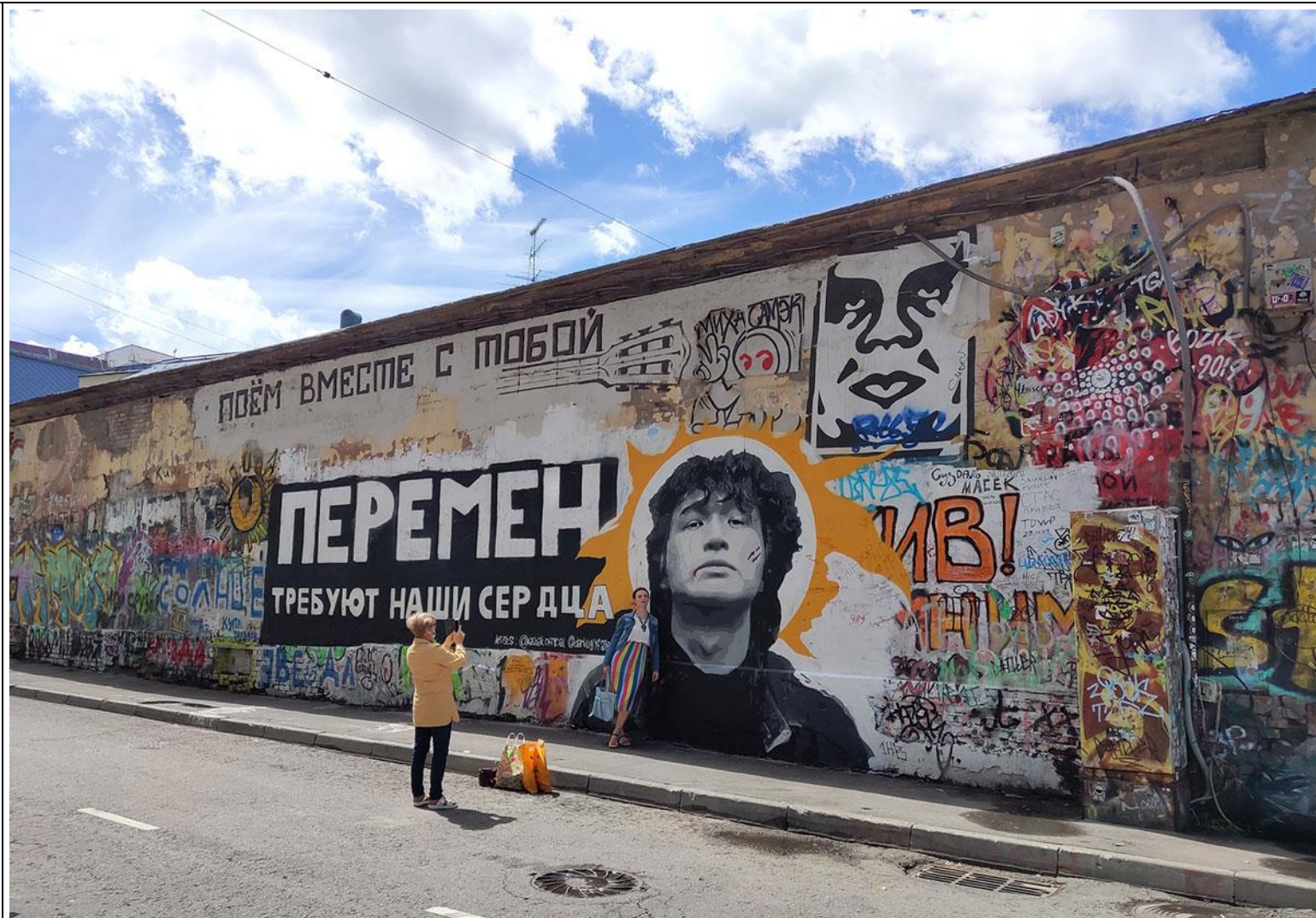
Стена памяти Виктора Цоя