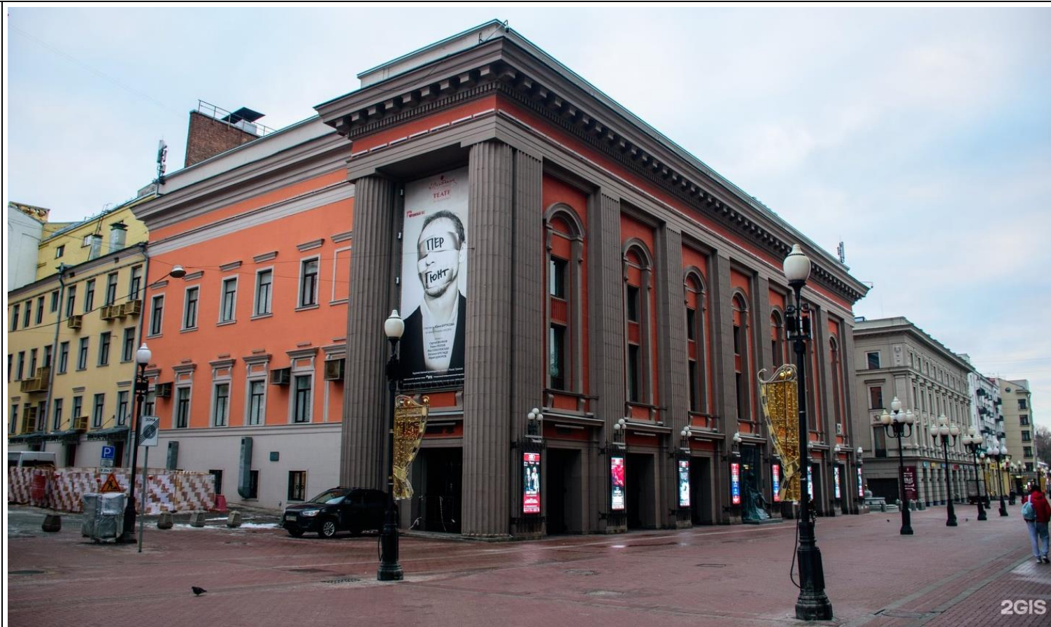
Театр им. Евгения Вахтангова