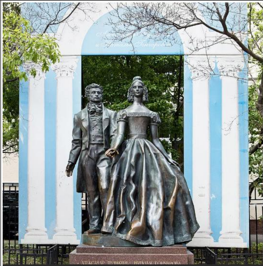
Скульптура «Пушкин и Натали»