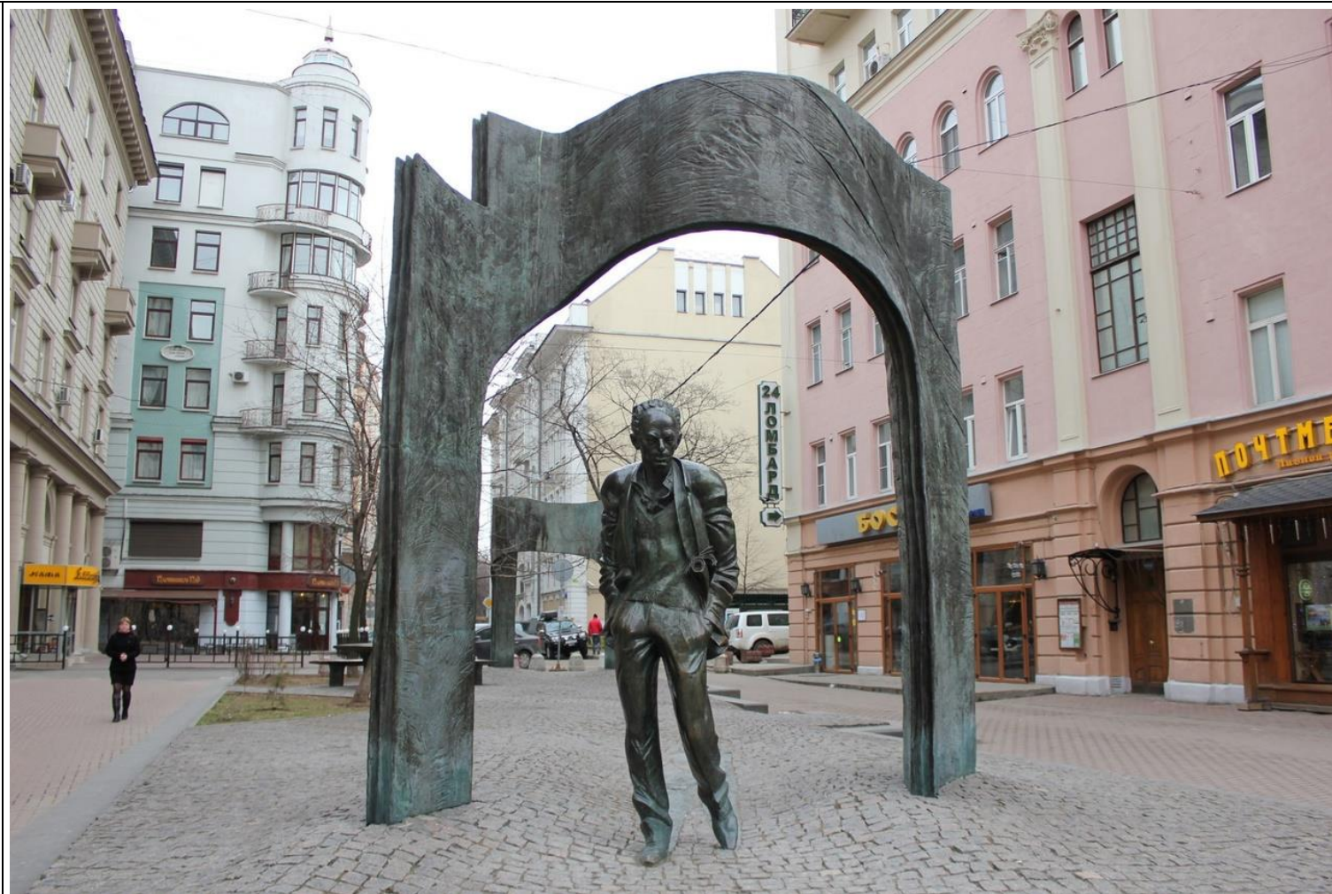
Дом №43. Памятник Булату Окуджаве