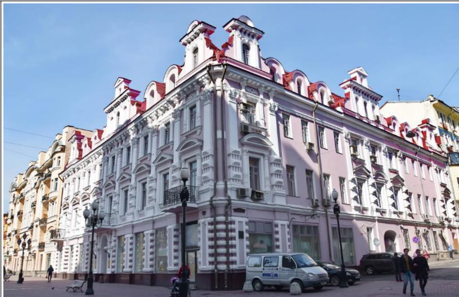
Доходный дом М. А. Скворцова (№ 28/1)