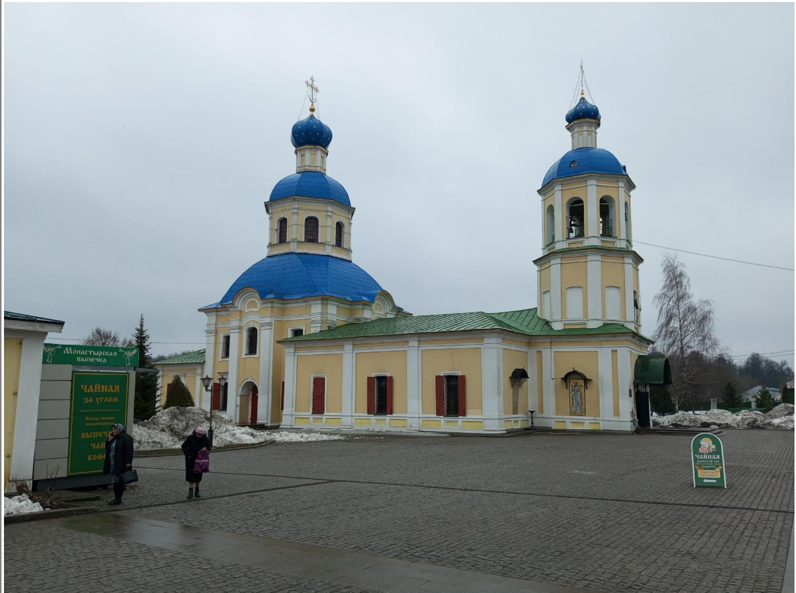
Церковь Петра и Павла