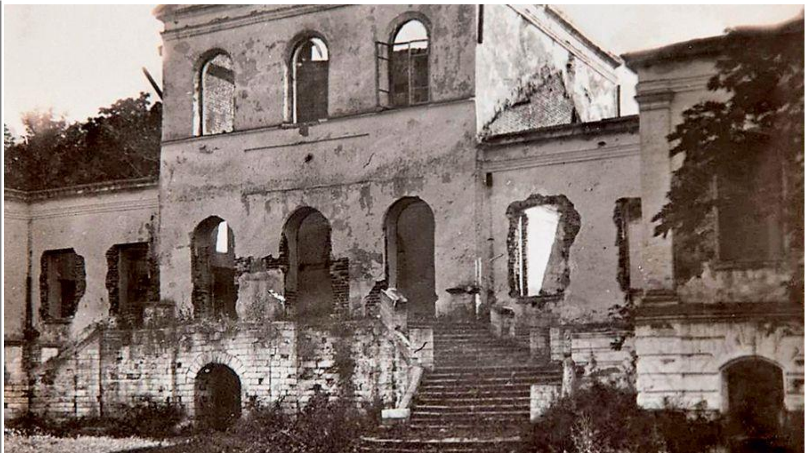
Господский дом после пожара 1920гг