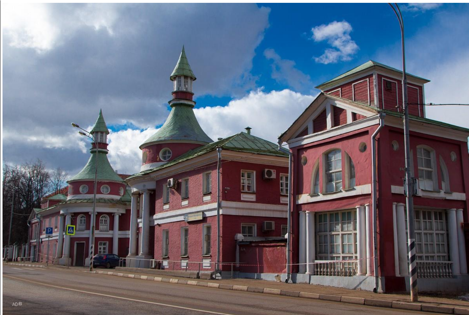
Экономия (конный двор)