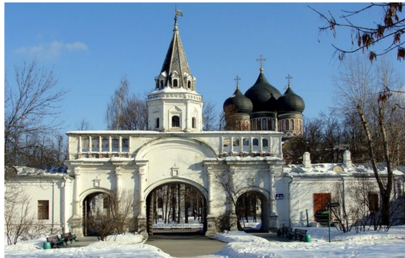
Каре Государева двора, Передние ворота, 1682г.

В 1920-е годы в Мостовую башню также пришли коммунары. Коммуна авиационного завода «Салют» — одна из первых в Москве — заняла весь Измайловский остров, ставший рабочим городком имени Баумана. В бывших палатах поселились строители нового государства. Позже в советское время в башне располагались коммуналки и различные учреждения. Сегодня здесь работает музей «Московский изразец», открытый в башне в 2008 году.