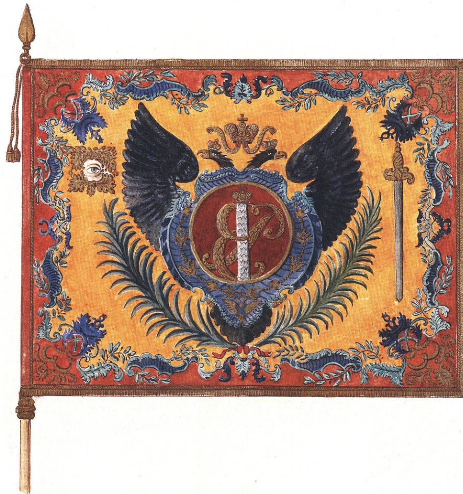
Знамя лейб-гвардии Семеновского полка

Семеновский полк принимал участие в многих событиях той поры: бок о бок с преображенцами семеновцы шли в бой и под Нарвой (1700), и под Полтавой (1709). Впоследствии Семеновский полк сохранил свое положение, и многие чины его известны до сих пор. Так, в Семеновском полку (в разное время, разумеется) состояли А. В. Суворов, М. Н. Тухачевский и декабристы М. П. Бестужев-Рюмин и С. И. Муравьев-Апостол. Также нужно отметить, что Лев Толстой в “Войне и Мире” определил Долохова именно в Семеновский полк!